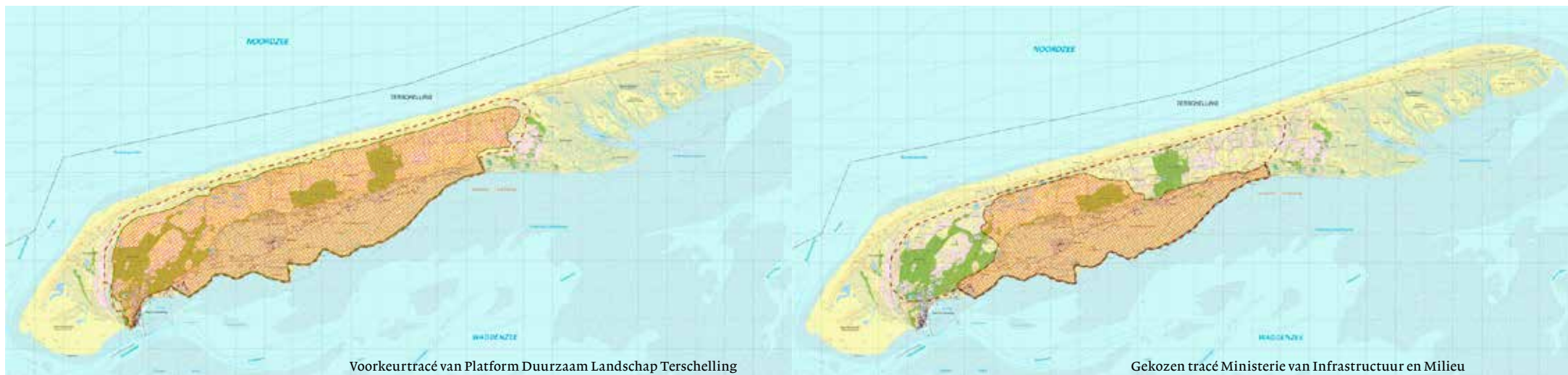
Voorkeurtracé van Platform Duurzaam Landschap Terschelling